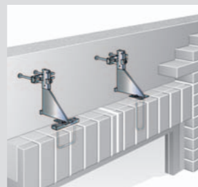
Překlady nad okny nebo dveřmi např. s prefabrikovanými překlady