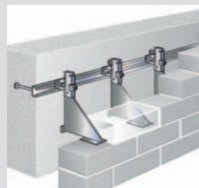
Oblast běžné stěny